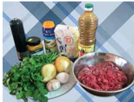
1. Подготавливаем все необходимые ингредиенты для нашего Душпере

Душпере – самое популярное и любимое блюдо горских евреев. Блюдо одно, а вот названий у него – два. И горские евреи, выходя из разных регионов, то и дело подтрунивают друг над другом: мол, что ты больше любишь – Курзе или Душпере? Что ж, любим мы больше то, что вкуснее приготовлено, а как это блюдо