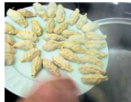
9. Бросаем Душпере, помешивая, в кипящую воду, добавляем куркуму. После того как Душпере всплывут, варим их не менее 10 минут

Все материалы и комментарии читайте на www.stmegi.com