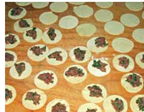
5. Тесто раскатываем в пласт толщиной 2–3 мм, круглой формочкой или стаканом вырезаем заготовки диаметром 5–6 см и выкладываем на них начинку