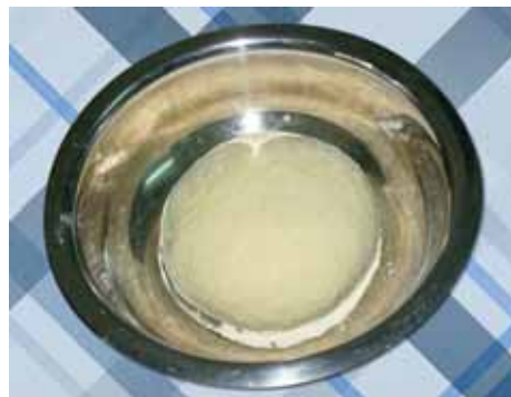
3. Оставляем тесто на 20–30 минут, чтобы оно отстоялось