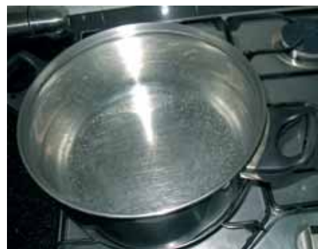
8. В глубокую кастрюлю наливаем 2–3 литра воды, солим и доводим до кипения