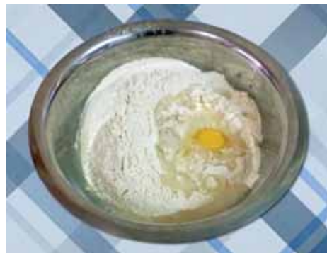
2. Из муки, яйца, соли и воды замешиваем крутое тесто