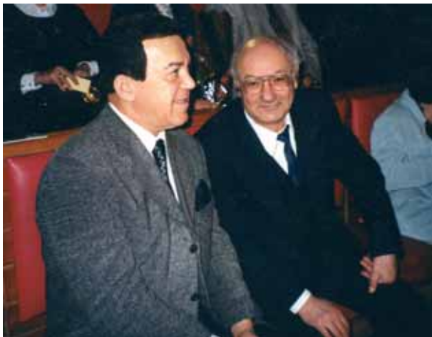
С Иосифом Кобзоном