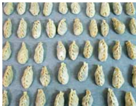
7. Раскладываем Душпере на салфетке, расстеленной на столе