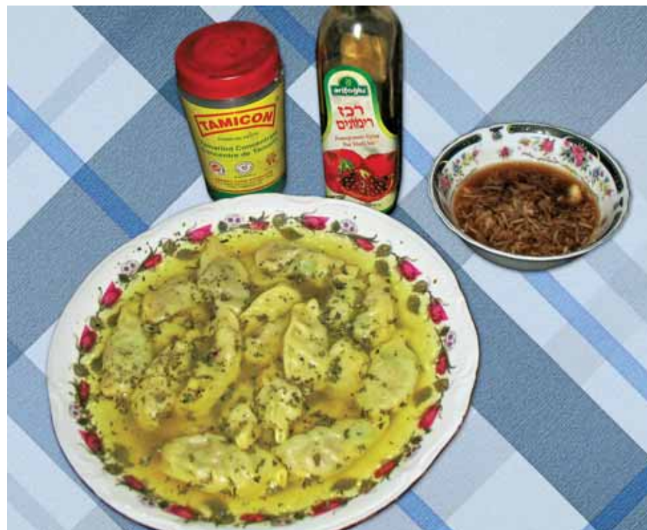
10. Готовое Душпере подают на стол с соусом из уксуса и тертого чеснока или с турци, а сверху посыпают сушеной мятой