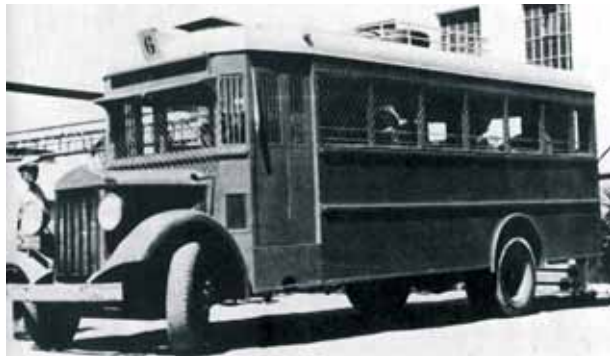
Автобус еврейской самообороны времён беспорядков 1936–1939 годов — мощные решетки защищали пассажиров от камней, бутылок и гранат