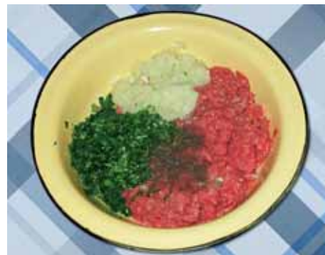
4. В говяжий фарш добавляем прокрученный на мясорубке лук, мелко нарезанную кинзу, соль, перец и хорошенько всё перемешиваем