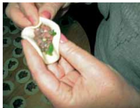
6. Заворачиваем Душпере, соединяем края и защипываем, как делают с пирожками, шов должен получиться похожим на косичку или змейку