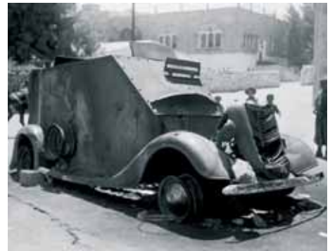
Импровизированный броневик еврейских отрядов самообороны, сожженный арабами в августе 1938 года

британцев. Так что в первую очередь требовалось оружие — и проблем с ним вроде как не предвиделось. Вооружение похищалось, угонялось и покупалось у тех же «мандатников»-англичан, полноводными контрабандными реками текло из Европы, превратившейся в грандиозную свалку смертоносного железа, а иногда даже покупалось официально — с неимоверными ухищрениями. В результате за два с лишним послевоенных года Палестину буквально напичкали тайными арсеналами. Миллионы патронов, десятки тысяч винтовок, автоматов и пулеметов, а еще минометы и даже немного пушек. Но в основном это было всего лишь легкое стрелковое оружие.