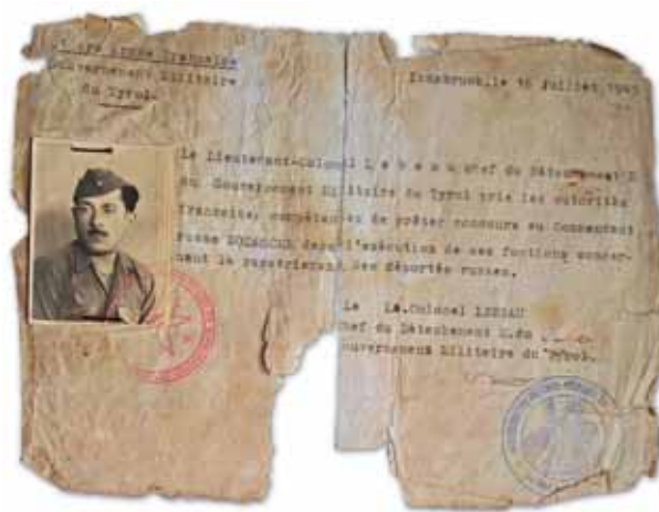
1-я Французская армия Военное губернаторство Тироля