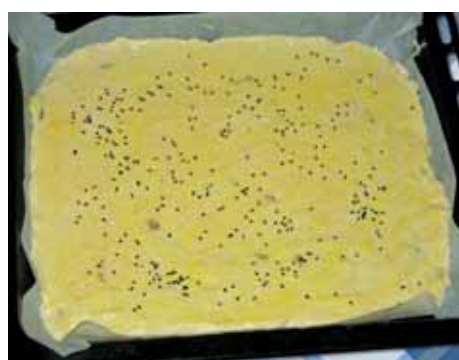
9. Смазываем яичным желтком, посыпаем кунжутными семечками и маком