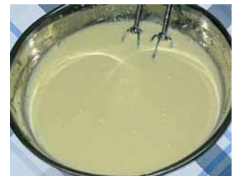
3. Затем взбиваем получившуюся смесь миксером до образования густой пены