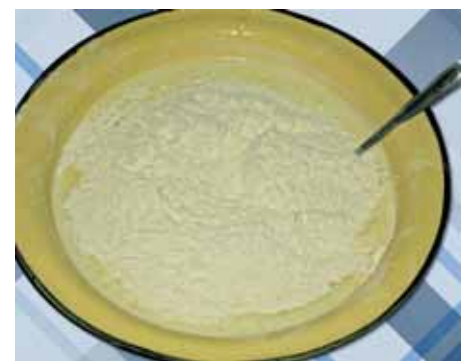
6. Добавляем в эту миску три стакана муки и перемешиваем ложкой