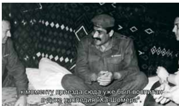
Генерал Йекутиэль Адам – в центре