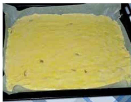
8. Получившуюся массу выкладываем в большой противень, а затем расправляем ее ложкой или мокрой рукой