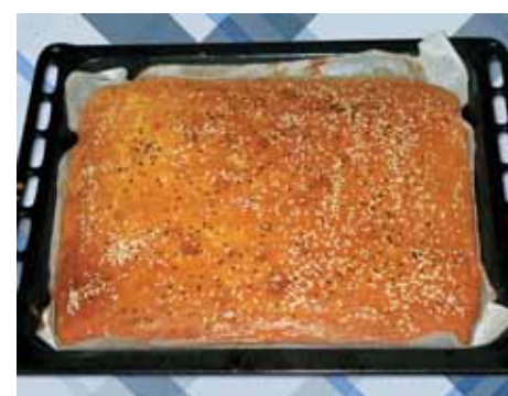
10. Кладем противень в печь и выпекаем пирог в течение 1 часа при температуре 180 °С, желательнo в турборежиме