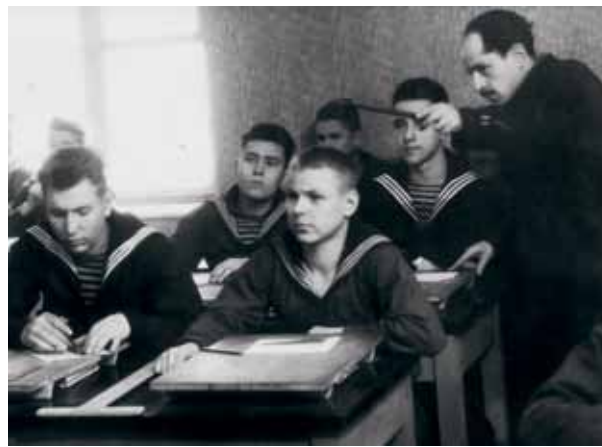
Преподавание в Рижской мореходной школе