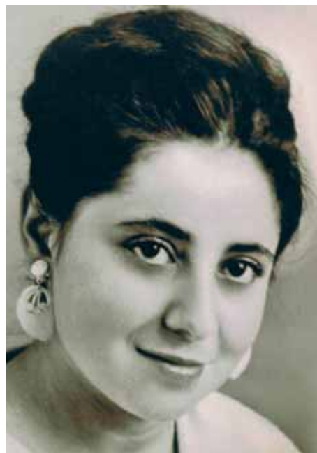
20 лет, студентка Кабардино-Балкарского университета

– Общественной деятельностью я занималась и до эмиграции в Америку (2001). И неоднократно принимала участие в еврейских форумах и съездах России, избиралась в президиум Конфедерации еврейских организаций и общин. Живя в США, на протяжении вот уже 14 лет регулярно участвую в научных конференциях в России, Израиле, Германии и США. Восемь лет была главным редактором журнала «Товуши-Свет», а также редактором и составителем сборника «Дети войны». Также я автор книг «Спешите делать добро», «История и этнография горских евреев Северного Кавказа в документах 1829–1917 гг.», «Горские евреи КБР», «Черкесы в Израиле», «Исход горских евреев – разрушение гармонии миров», «Сердца, дарящие тепло» и «Разорванный круг». В настоящее время я волонтер американской организации «Дети войны». Мы уже издали два сборника на эту тему под моей редакцией и готовим еще одну книгу.