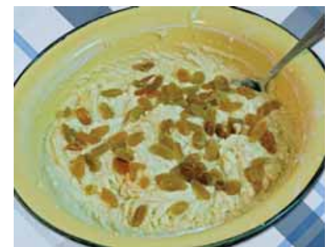
7. Добавляем промытый изюм и снова тщательно перемешиваем