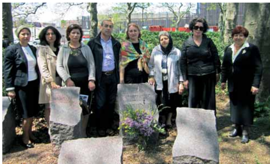
Мемориальный парк в Бруклине (Нью-Йорк, США) – камни в память о тех местах в бывшем СССР, где прошли расправы над евреями. Здесь стоит и поминальный камень от родственников жертв в селе Богдановка. Уже семь лет мы приходим сюда 9 мая, раввин читает кадиш, люди вспоминают, как это было, и просят у Б-га мира для всех