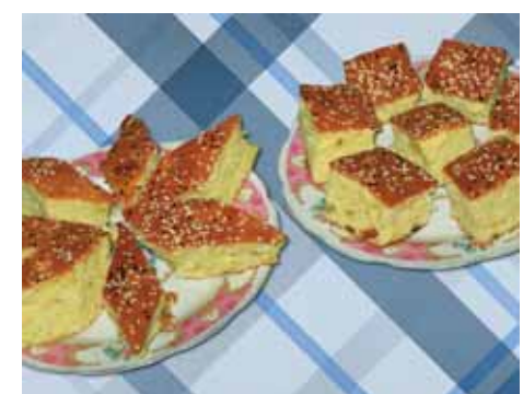
11. Наш творожный пирог готов, через 30 минут нарезаем его на кусочки разной формы, раскладываем по тарелкам и подаем на стол