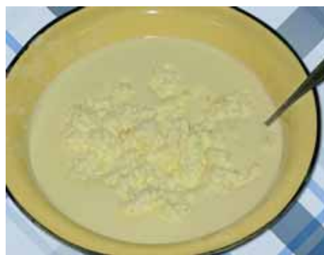
5. Берем большую миску, соединяем обе массы вместе и перемешиваем миксером