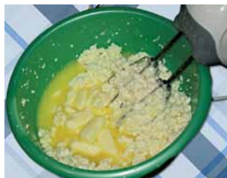
4. В другую миску выкладываем творог с остальным сахаром, перемешиваем, добавляем ваниль, соду, цедру лимона, масло и перемешиваем миксером