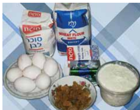
1. Подготавливаем все продукты для нашего праздничного Килчэ с изюмом

Сегодня в нашей вкусной рубрике «Кейвони» мы расскажем, как испечь творожный пирог – Килчэ с изюмом, который горские евреи Кавказа готовили на