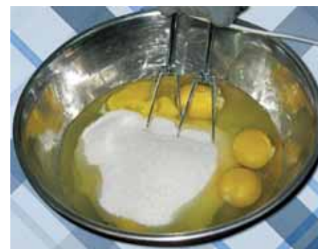
2. В глубокую миску разбиваем шесть яиц и насыпаем два стакана сахара

Приятного аппетита! Хуш халол ишму! Эри шорэ сифроо сохощит! (Дай Бог на радость печь!)