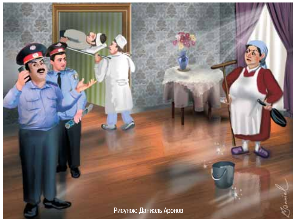
Рисунок: Даниэль Аронов