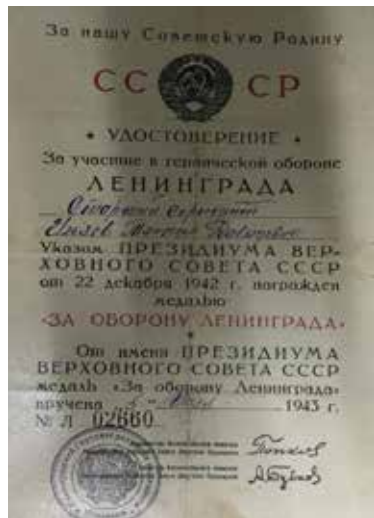
Удостоверение к медали «За оборону Ленинграда».