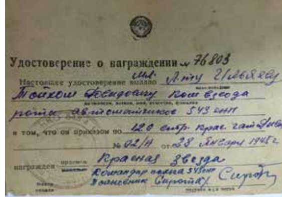
Удостоверения к наградам орденами Красной Звезды.