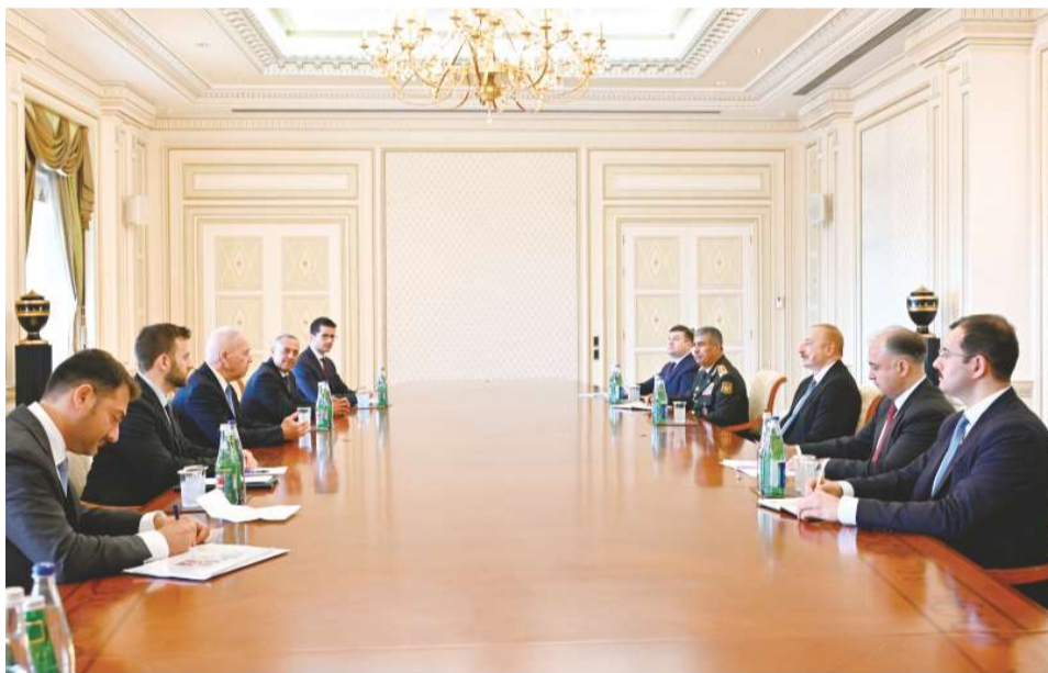
13 июля Президент Азербайджанской Республики Ильхам Алиев принял министра обороны Государства Израиль Йоава Галанта.

Как сообщает АзерТАдж Йоав Галант передал главе государства приветствия премьер-министра Израиля Биньямина Нетаньяху.